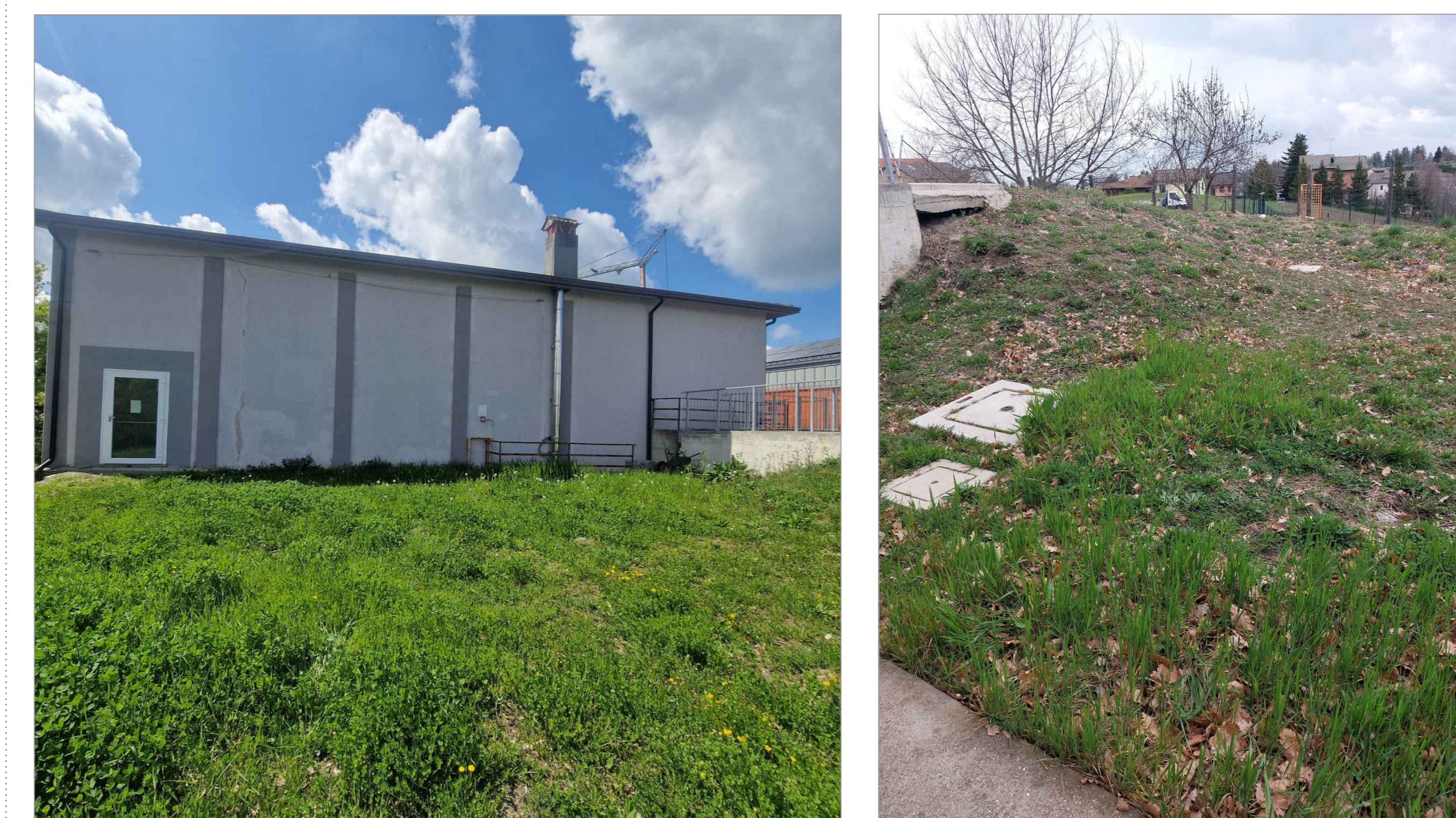
VISTA SU AREA D'INTERVENTO - Stato di Fatto