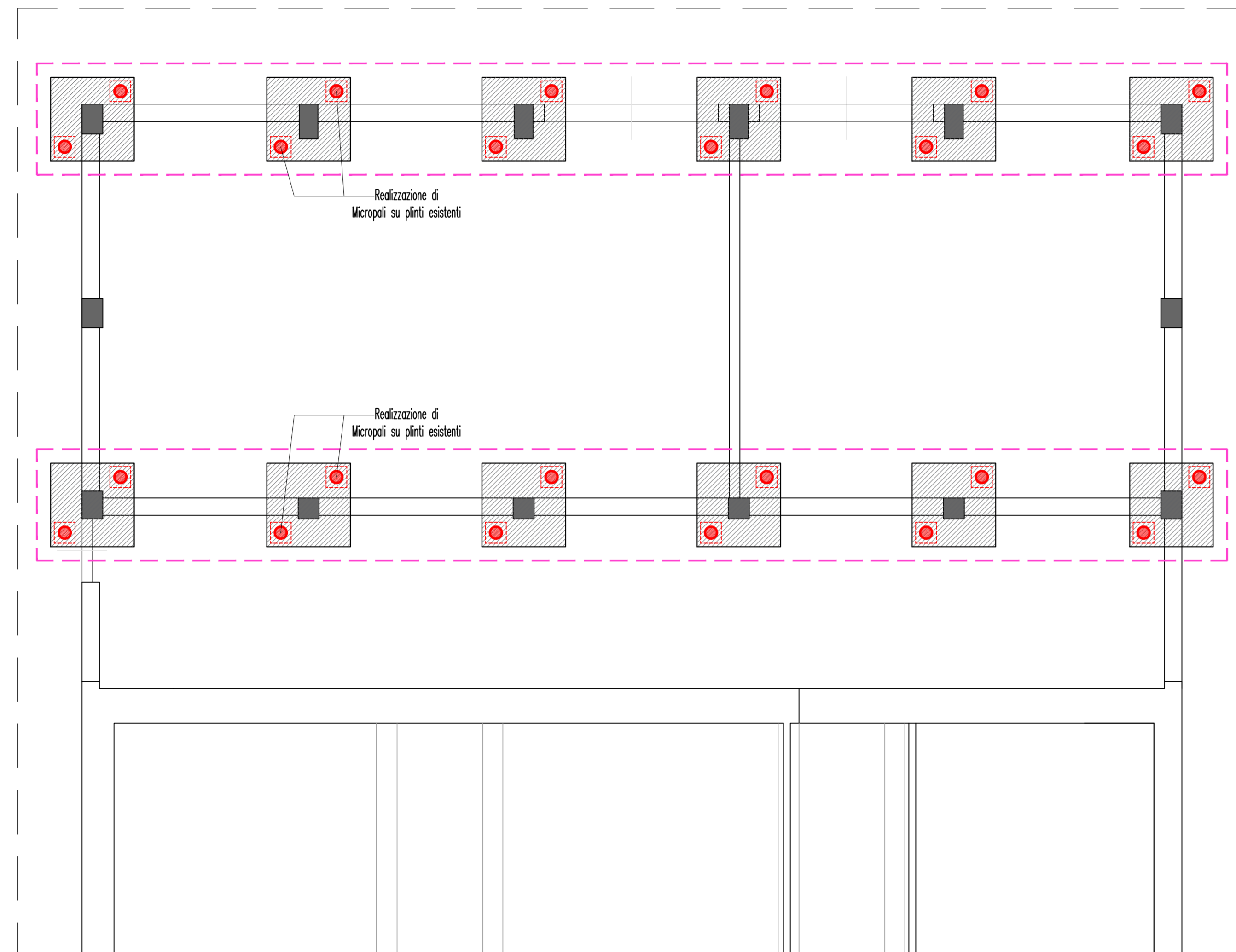
STRALCIO PIANTA SCUOLA PIANO TERRA ZONA NORD Scala 1:50