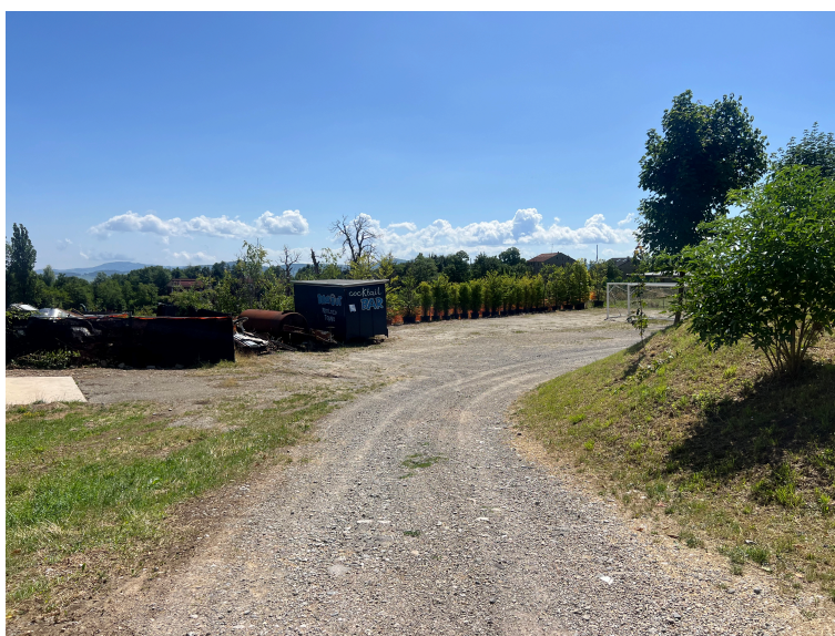
Vista zona nord-est campo da calcio – area parcheggi