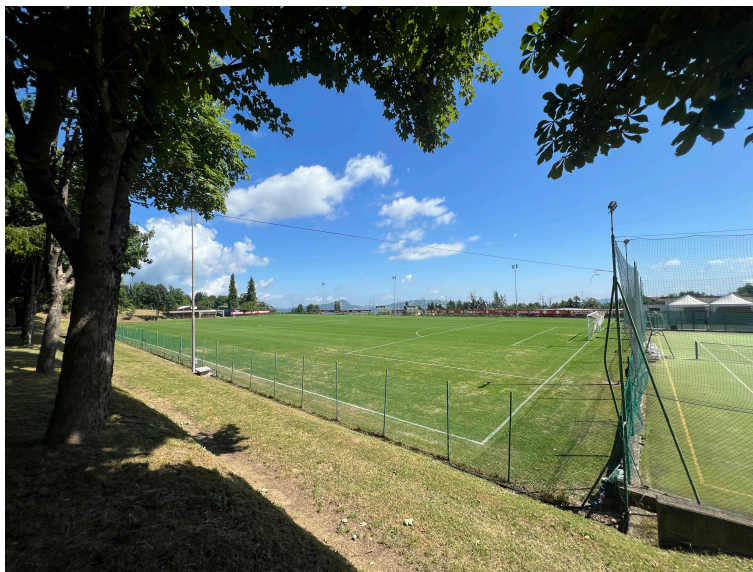
Vista campo da calcio lato ovest