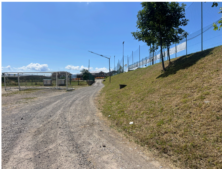
Vista lato est campo da calcio – area nuovo spogliatoio