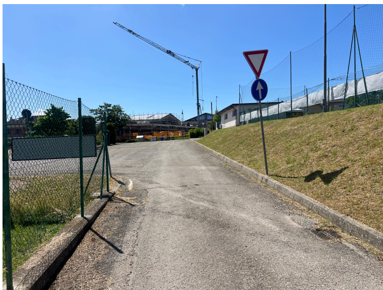
Strada di collegamento zona est