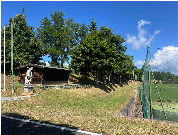
Zona sud ovest campo da calcio