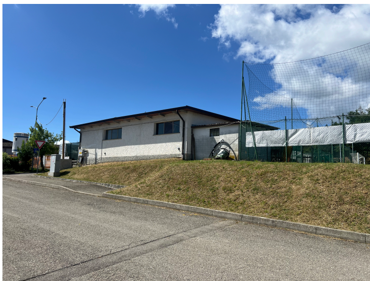
Vista sud- vecchio spogliatoio