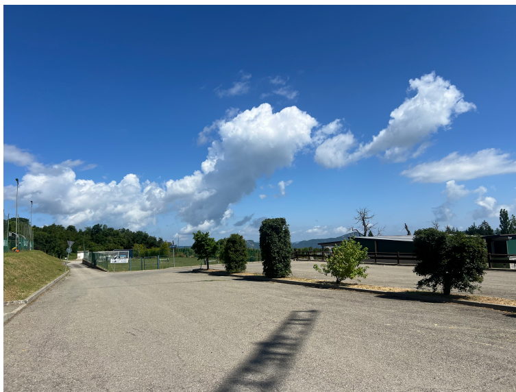
Area parcheggi centro sportivo lati sud-est