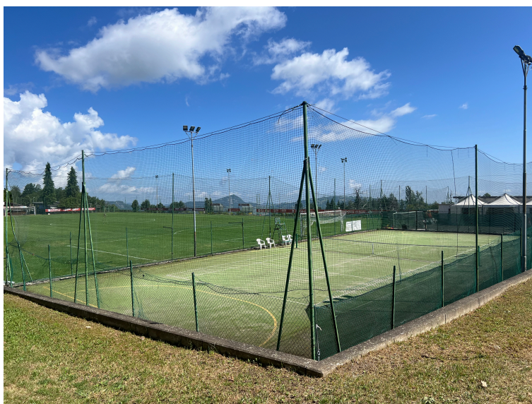
Zona sud ovest campo da tennis